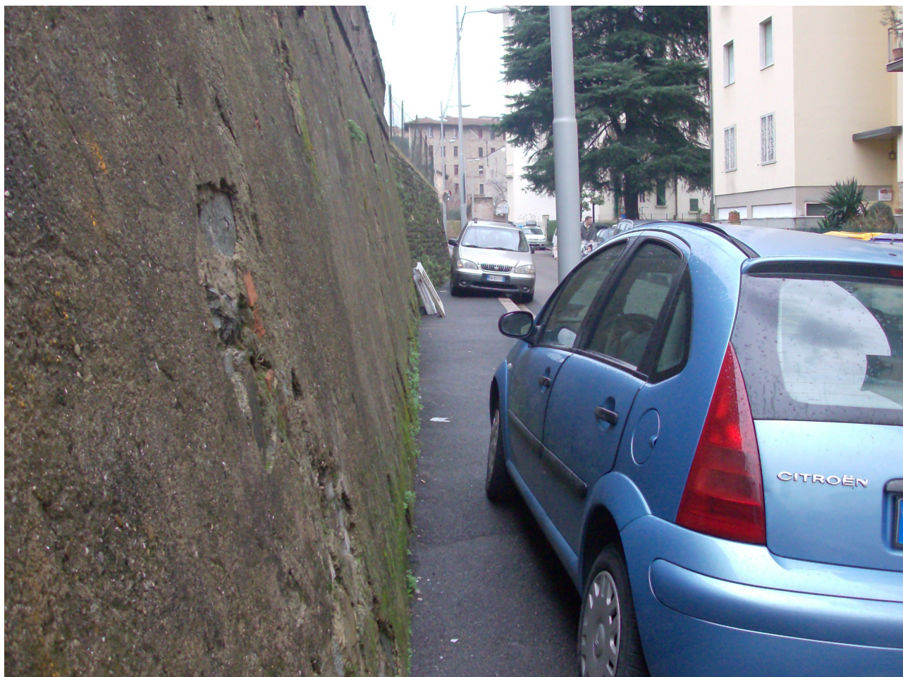
( Firenze 1° Febbraio 2014 )

Signori Consiglieri, come potete notare non si tratta di Soncino ma di...Firenze ( Granducato di Toscana 1569- 1859).